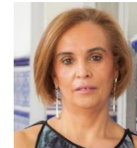
Pilar Melara San Román Reputación corporativa, marca y modelos de medición